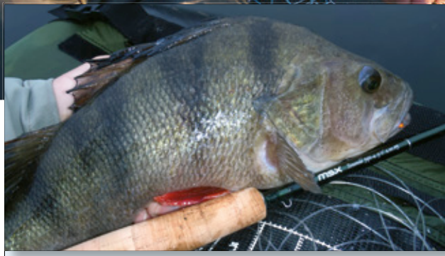
In de havens kun je in de winter niet alleen veel vangen, maar ook veel uiteenlopende soorten.