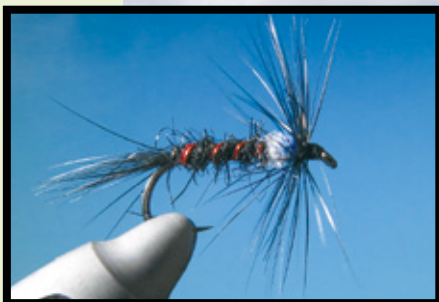
Van boven naar beneden: 3D Traffic Light buzzer, DTC Black red butt buzzer, Black twinkle buzzer, UV black & gold buzzer en Two colour black cruncher.