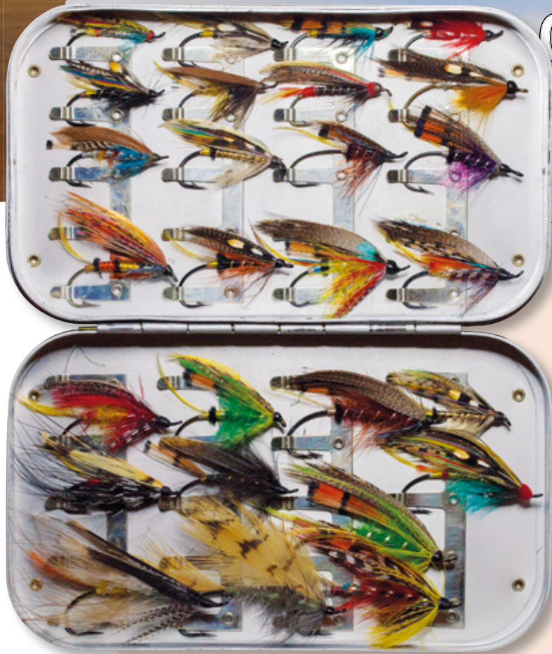
Doosje vol met full dressed zalmvliegen... om mee te vissen!

Peter de Coensel bindt op hoog niveau zalmvliegen en is op de British Fly Fair International een graag geziene demonstratiebinder van klassieke zalmvliegen. In deze speciale uitgave mag hij dan ook niet ontbreken. Bovendien is Peter ook een fanatiek vliegvisser, die graag met zelfgebonden klassieke zalmvliegen op zalm vist. Peters creaties eindigen dus niet gegoten in een blok kunststof en staan evenmin te verstoffen op een schoorsteenmantel. Zijn vliegen wacht het lot in de bek van een echte, wilde Atlantische zalm te verdwijnen.