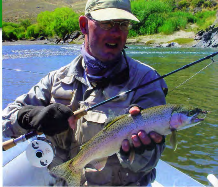
Mooi getekende wilde Futaleufu regenboogforel.