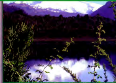
Lago Yelcho met op de achtergrond de Cerro Tronador.

Voor de volgende dagen stond de Rio Manso op het programma. De Rio Manso ontspringt vanaf een gletsjer in de Andes en stroomt na ongeveer 12 km in Lago Mascardi. Vanaf dit meer stroomt de Manso verder, om kort daarna Lago Los Moscos, "muggenmeer", te bereiken. Daar begon onze floattrip, die ons stroomafwaarts na ongeveer 8 km tot Lago Hess zou brengen. De Rio Manso is hier zeer gevarieerd. Bochtige stukken met stroomnaden en high banks worden afgewisseld door rustig stromende bredere en diepere ge-