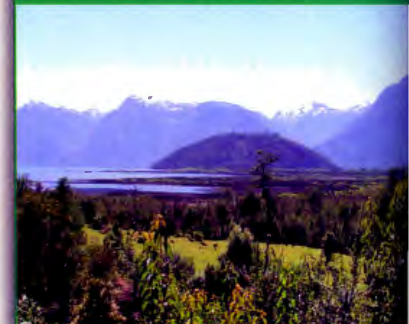
Lago Yelcho tussen de Andes toppen.

deeltjes. Overal kon echter forel gevangen worden. Tegen de high banks aan waren de sprinkhaan imitaties zeer productief. Wanneer de gids de boot aan de kant legde, kon ik op zicht de kruisende forellen tegen de andere oever aanwerpen. Onvergetelijk was de bruine forel die net omkeerde