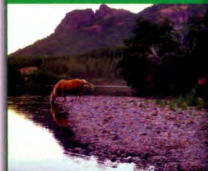
Paarden aan de oever van Rio Meliquina.