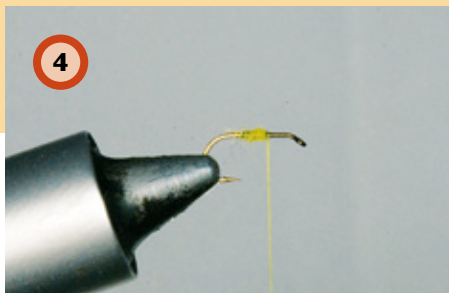
Als variatie op dit patroon kun je bijvoorbeeld, in plaats van de CDC-veer, rubber dubbing of een India skin hackle gebruiken.