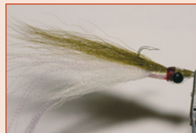
(Van links naar rechts:) Clouser, Jiggy, Sandeel, Clouser Variant